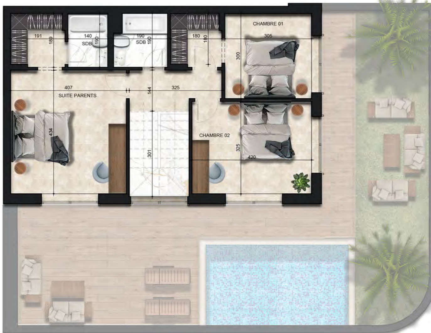
- PLAN MEZZANINE -

PLANS PRÉLIMINAIRES SUJETS À CHANGEMENTS. LA SUPERFICIE HORS ŒUVRES DES LOGEMENTS INCLUT CELLE DES BALCONS ET/OU TERRASSES COUVERTS. LA SUPERFICIE ET LA DIMENSION DES PLANS DE VENTE SONT APPROXIMATIVES ET PEUVENT VARIER. L'AMÉNAGEMENT PROPOSÉ PEUT VARIER SELON LA POSITION DES FENÊTRES ET PORTES DES BALCONS. LES RETOMBÉES DES PLAFONDS SONT SUJETTES À CHANGEMENTS.