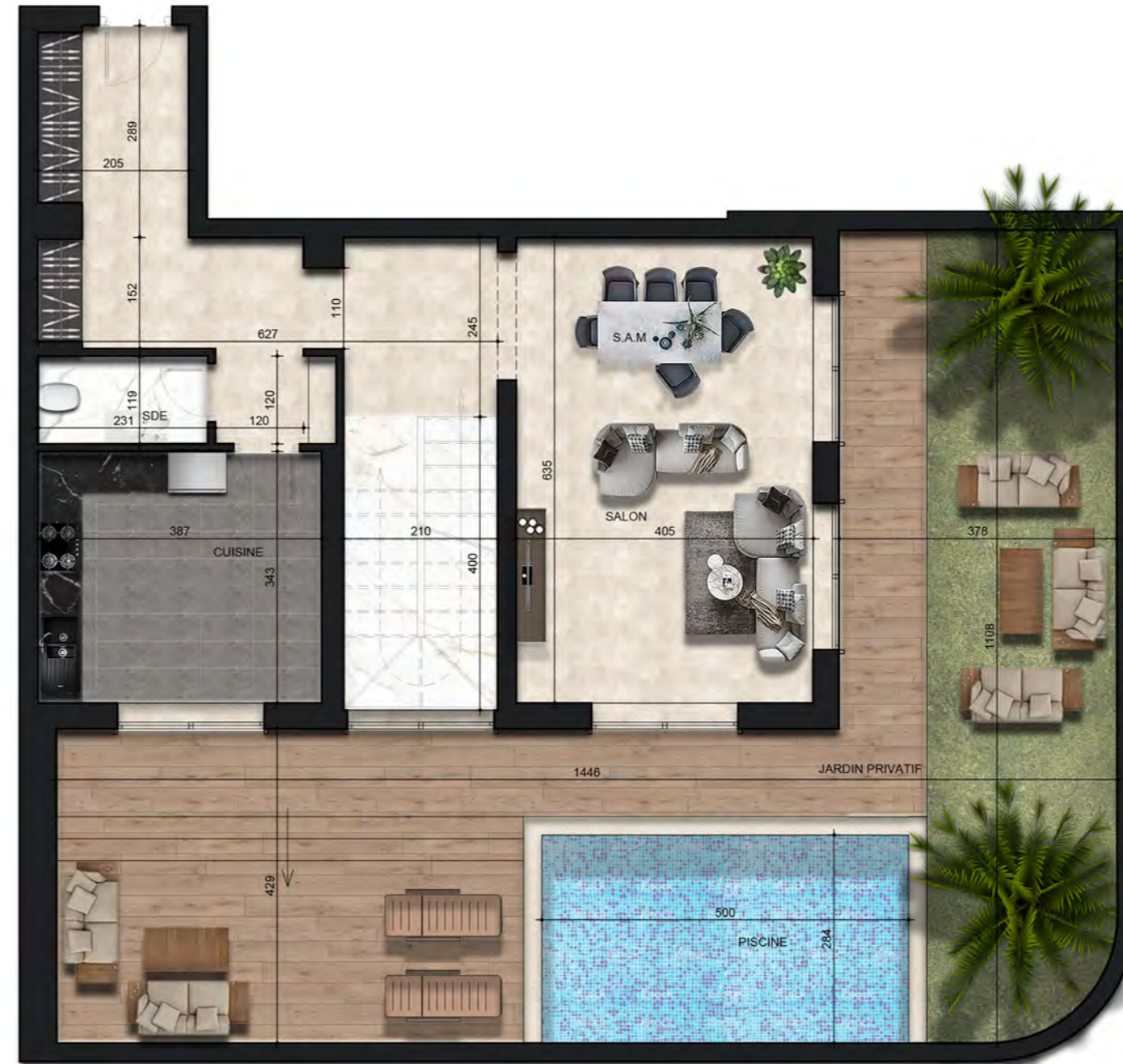
- PLAN RDC -

PLANS PRÉLIMINAIRES SUJETS À CHANGEMENTS. LA SUPERFICIE HORS ŒUVRES DES LOGEMENTS INCLUT CELLE DES BALCONS ET/OU TERRASSES COUVERTS. LA SUPERFICIE ET LA DIMENSION DES PLANS DE VENTE SONT APPROXIMATIVES ET PEUVENT VARIER. L'AMÉNAGEMENT PROPOSÉ PEUT VARIER SELON LA POSITION DES FENÊTRES ET PORTES DES BALCONS. LES RETOMBÉES DES PLAFONDS SONT SUJETTES À CHANGEMENTS.