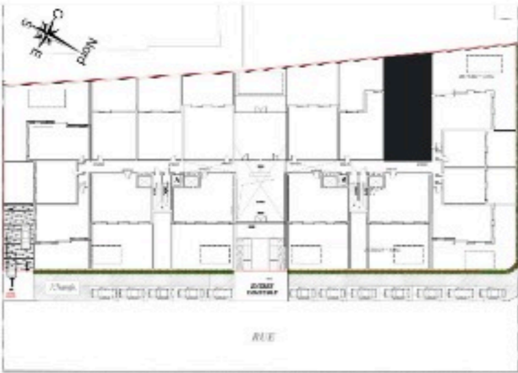
RDC - PLAN DE REPÉRAGE