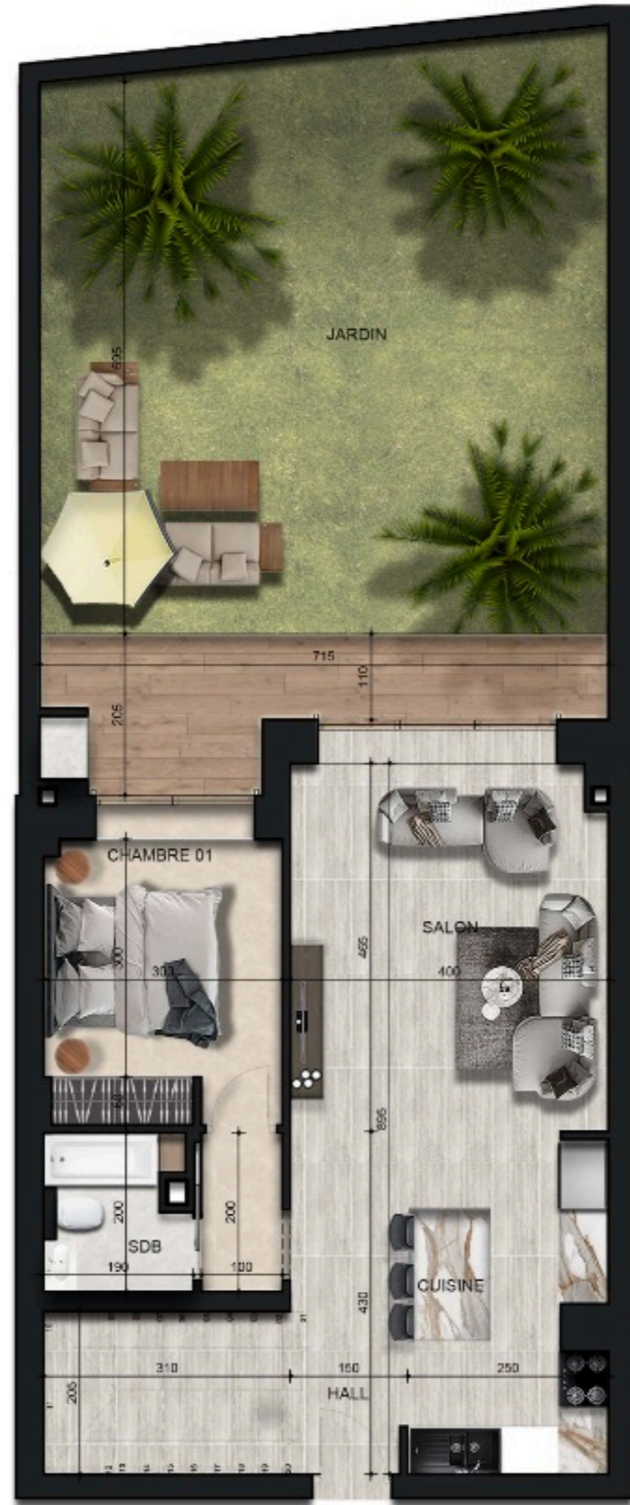
DUP B0-5/S+3 - PLAN RDC -