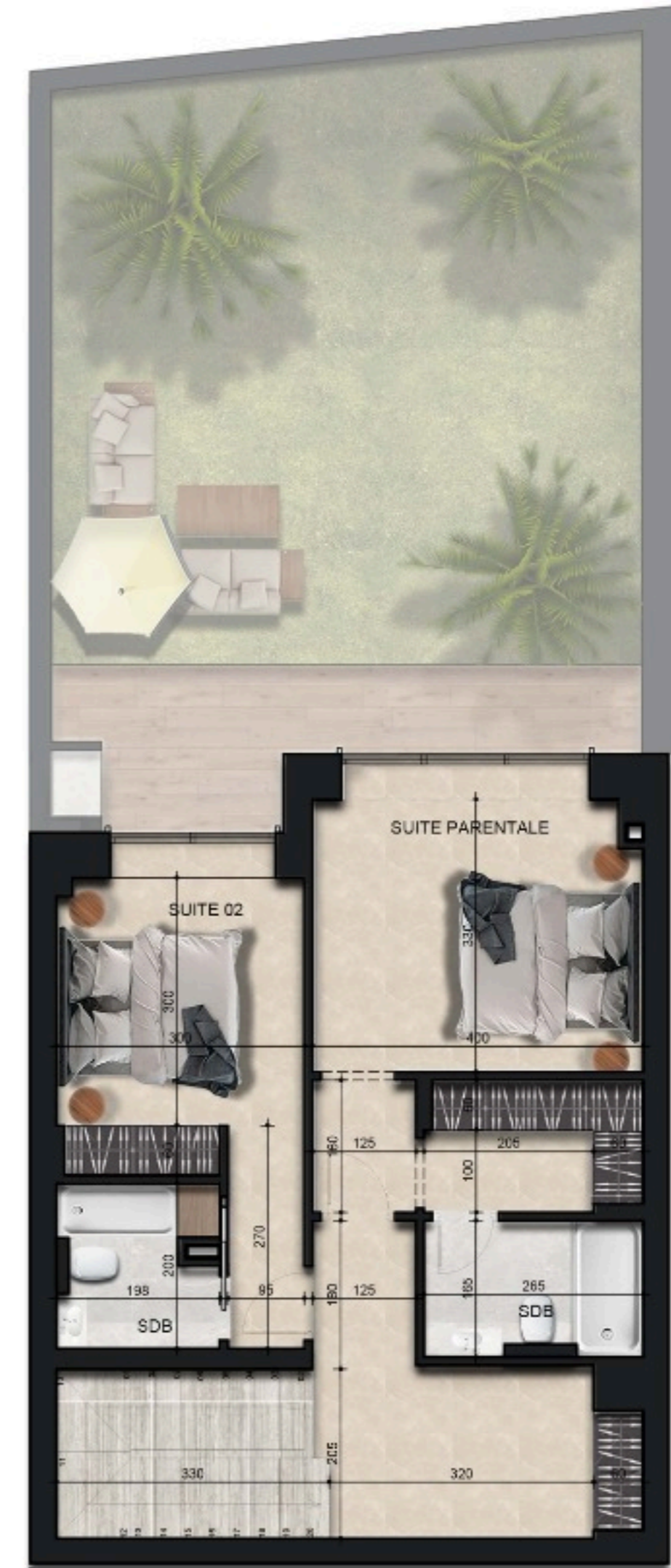
- PLAN MEZZANINE -