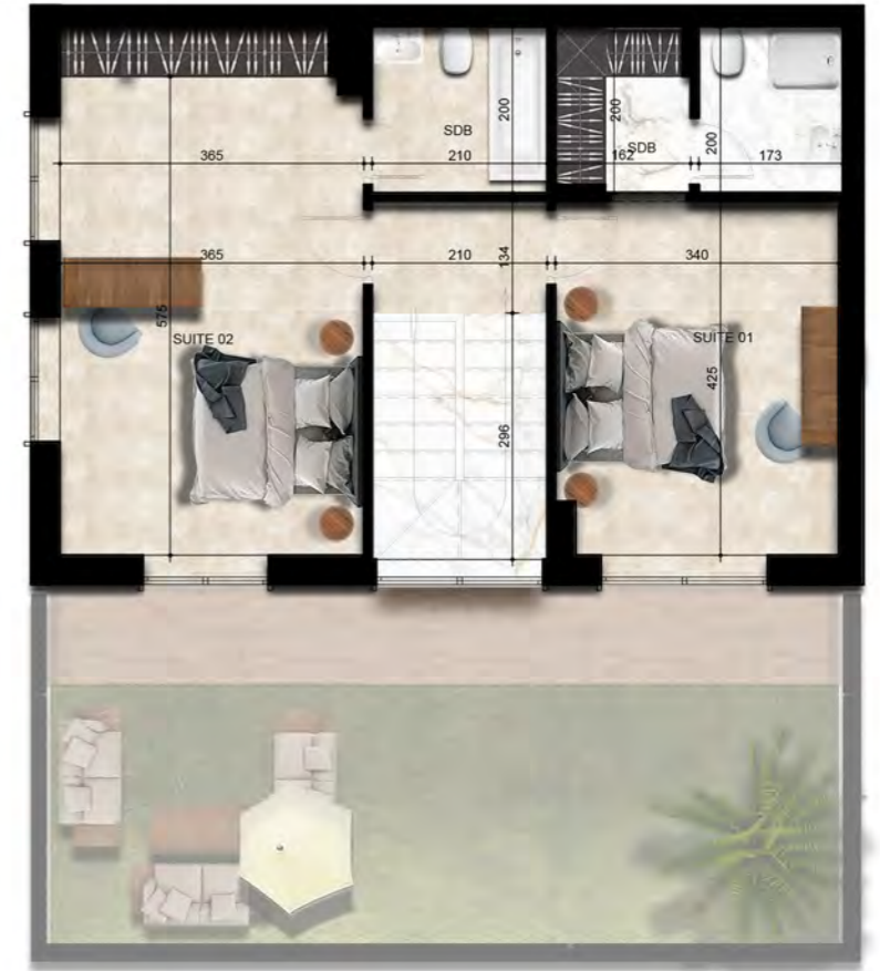
- PLAN MEZZANINE -

PLANS PRÉLIMINAIRES SUJETS À CHANGEMENTS. LA SUPERFICIE HORS ŒUVRES DES LOGEMENTS INCLUT CELLE DES BALCONS ET/OU TERRASSES COUVERTS. LA SUPERFICIE ET LA DIMENSION DES PLANS DE VENTE SONT APPROXIMATIVES ET PEUVENT VARIER. L'AMÉNAGEMENT PROPOSÉ PEUT VARIER SELON LA POSITION DES FENÊTRES ET PORTES DES BALCONS. LES RETOMBÉES DES PLAFONDS SONT SUJETTES À CHANGEMENTS.