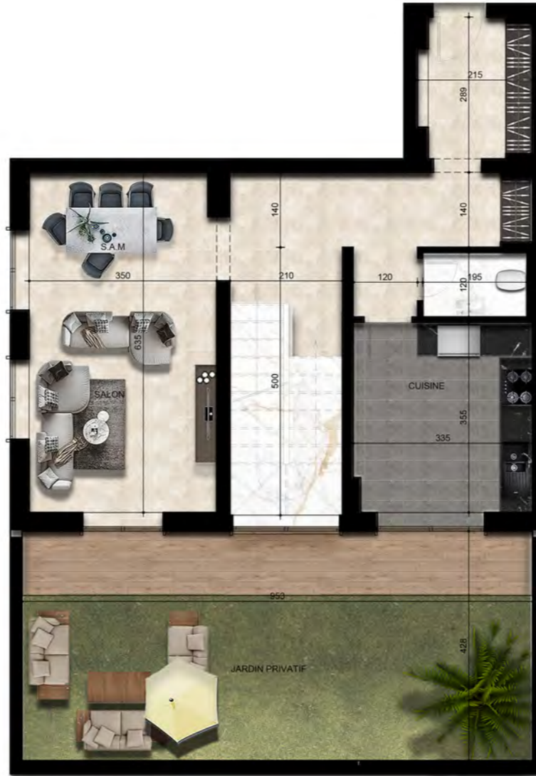
- PLAN RDC -