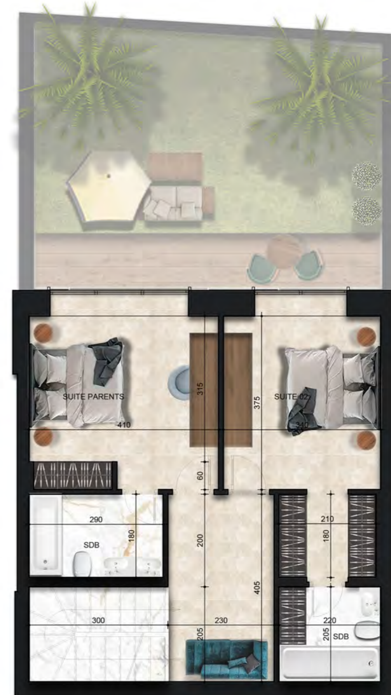
- PLAN MEZZANINE -

PLANS PRÉLIMINAIRES SUJETS À CHANGEMENTS. LA SUPERFICIE HORS ŒUVRES DES LOGEMENTS INCLUT CELLE DES BALCONS ET/OU TERRASSES COUVERTS. LA SUPERFICIE ET LA DIMENSION DES PLANS DE VENTE SONT APPROXIMATIVES ET PEUVENT VARIER. L'AMÉNAGEMENT PROPOSÉ PEUT VARIER SELON LA POSITION DES FENÊTRES ET PORTES DES BALCONS. LES RETOMBÉES DES PLAFONDS SONT SUJETTES À CHANGEMENTS.