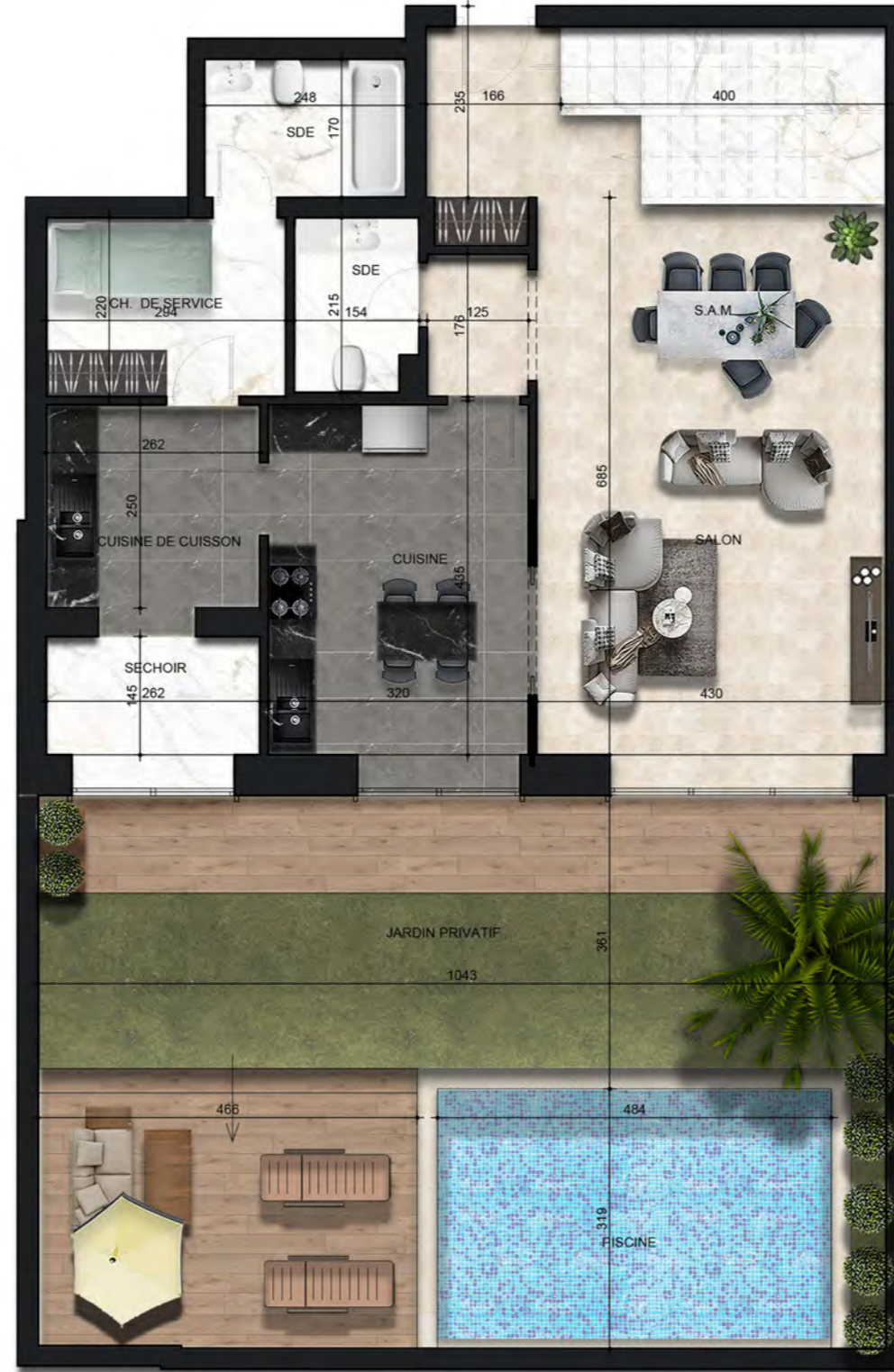
- PLAN RDC -