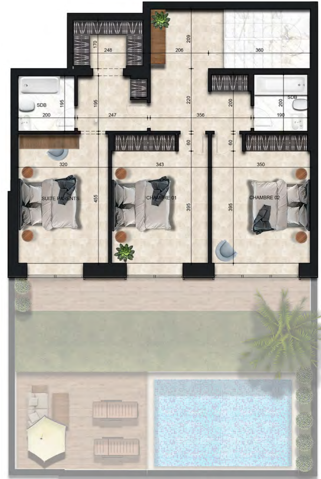
- PLAN MEZZANINE -

PLANS PRÉLIMINAIRES SUJETS À CHANGEMENTS. LA SUPERFICIE HORS ŒUVRES DES LOGEMENTS INCLUT CELLE DES BALCONS ET/OU TERRASSES COUVERTS. LA SUPERFICIE ET LA DIMENSION DES PLANS DE VENTE SONT APPROXIMATIVES ET PEUVENT VARIER. L'AMÉNAGEMENT PROPOSÉ PEUT VARIER SELON LA POSITION DES FENÊTRES ET PORTES DES BALCONS. LES RETOMBÉES DES PLAFONDS SONT SUJETTES À CHANGEMENTS.