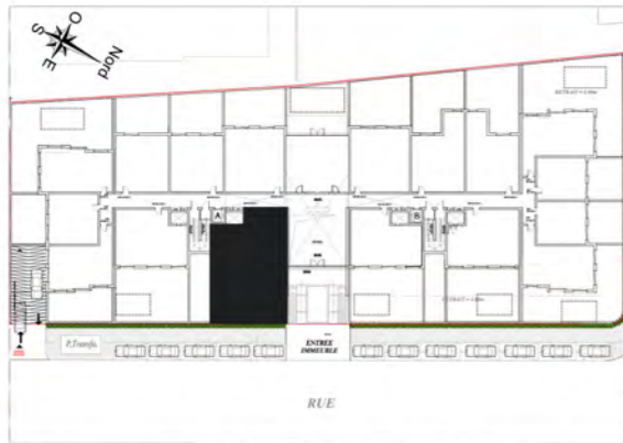
RDC - PLAN DE REPÉRAGE